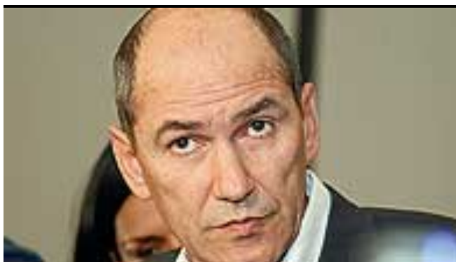
Janša: Dolgih vrst za državno srebrnino ni 42