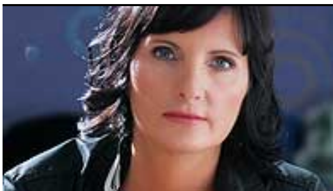
Kaj vse bo JJ še dal, da na oblasti bi ostal 290