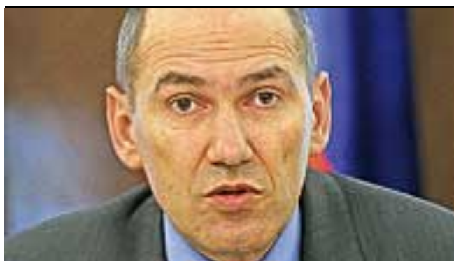
Večernji: Varčevalci LB so Janševa edina pre- ostala fronta 22