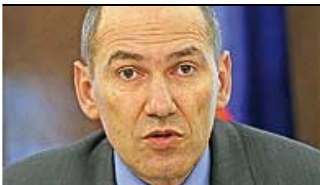
Janša: Holding je edini način, da ne breme- nimo žepov davkoplačevalcev 109