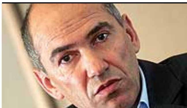
Janša svari z znižanjem standarda, če fiskal- no pravilo pade 50